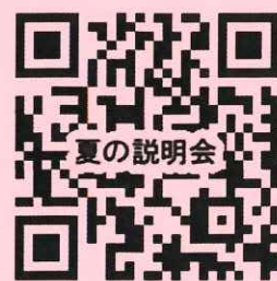
夏の説明会 申込み用 QR コード 後日ご連絡いたします。